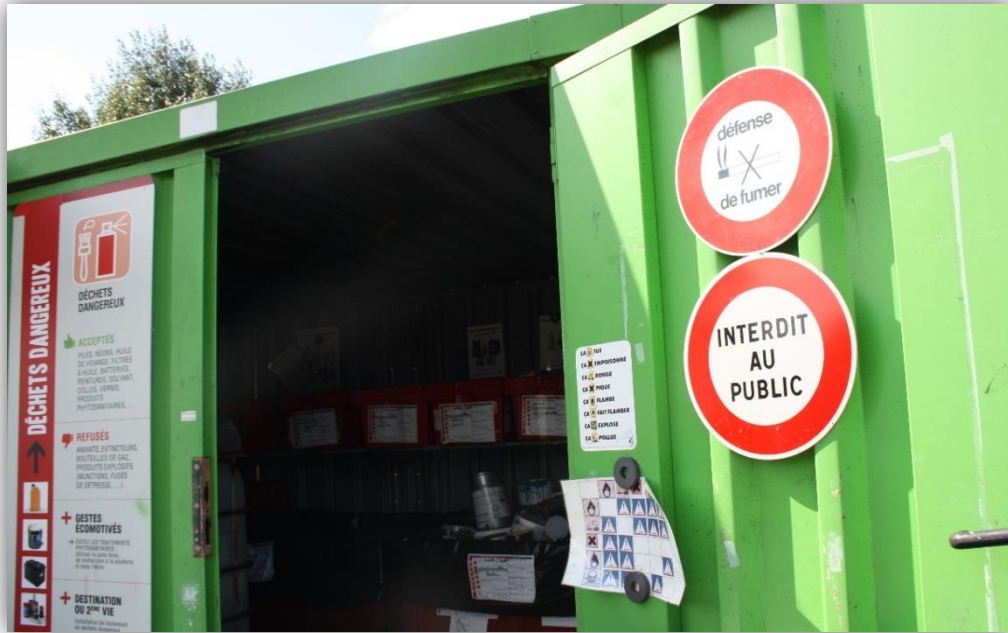
Signalisation « interdit au public » déchetterie à Port Brillet