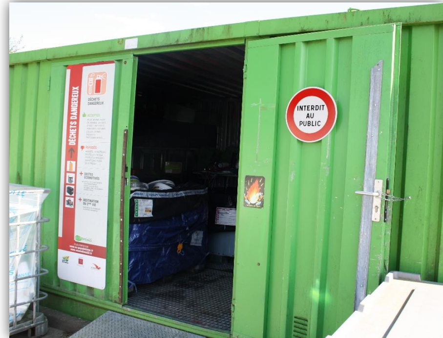
Signalisation « interdit au public » déchetterie à Montjean